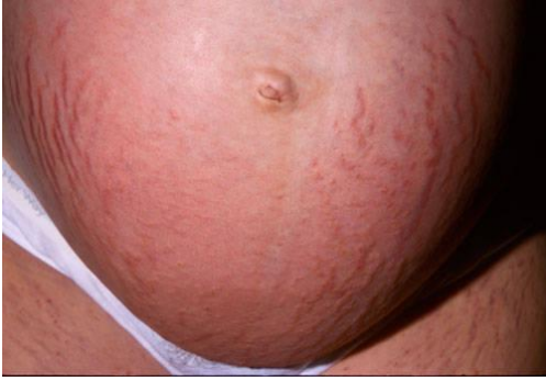
ภาพ แสดงผื่น PUPPP