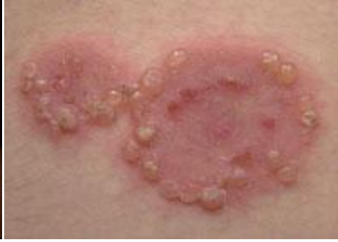
ภาพแสดงผื่น herpes gestationis

แต่ในปัจจุบันมีเทคโนโลยีที่ช่วยรักษาท้องลายที่พบว่าได้ผลดี โดยเฉพาะอย่างยิ่งในขณะที่รอยโรคยังใหม่ คือเห็นเป็นเส้นสีแดงปนชมพู ไม่มีรอยนูน ได้แก่ วิธีการกรอผิวด้วยเกร็ดอัลูมิเนียม (microdermabrasion) ,การใช้เลเซอร์ในกลุ่ม พัลส์ไดน์ (pulse dye) พบว่าได้ผลดีกับรอยโรคชนิดนี้ แต่กรณีที่ปล่อยทิ้งไว้ไม่ได้รับการรอยโรคก็จะกลายเป็นสีขาวและมีรอยนูนระยะนี้ จะรักษายากกว่า ได้แก่ การใช้แสง IPL, การใช้เลเซอร์ Q-switch Nd:YAG ,Excimer laser ,Diode และ Fraxel เป็นต้น