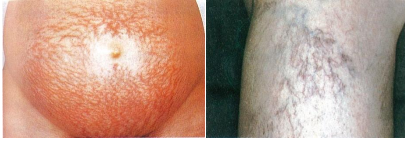
ภาพที่24 แสดงท้องแตกลาย