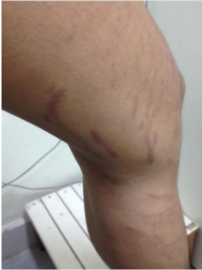
ภาพแสดงรอยแตกภายในหญิงมีครรภ์