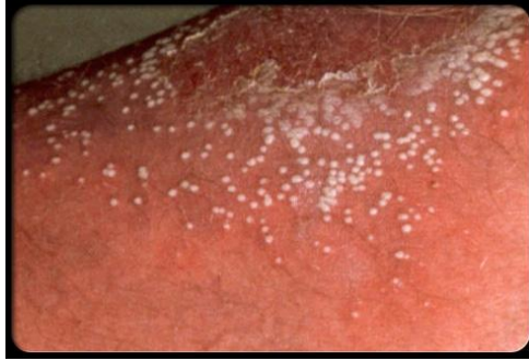
ภาพแสดง pustular psoriasis of pregnancy

3. Pustular psoriasis of pregnancy พบในช่วงไตรมาสที่3ของการตั้งครรภ์ ลักษณะเป็นผื่นแดงร่วมกับตุ่มหนอง กระจายทั่วลำตัว ผื่นมีอาการคันหรือเจ็บ มารดาอาจมีอาการไข้ หนาวสั่น คลื่นไส้ ปวดข้อร่วมด้วย ผื่นมักหายได้เองหลังคลอด แต่อย่างไรก็ตามอาจพบภาวะแทรกซ้อนที่อันตรายได้เช่น ภาวะแคลเซียมในเลือดต่ำ (hypocalcemia) ,การติดเชื้อแบคทีเรียในกระแสโลหิต (bacterial sepsis) , ภาวะรกเสื่อม (placental insufficiency) และทารกตายในครรภ์(still birth) การรักษาคือใช้ยาสตีรอยด์ขนาดสูงตลอดการตั้งครรภ์ ,ยาไซโคลสปอริน(cyclosporine) ,การรักษาด้วยแสงอัลตราไวโอเล็ตชนิดบี อย่างไรก็ตามภาวะนี้มีอันตรายทั้งมารดาและทารก ต้องได้รับการดูแลจากแพทย์ผู้เชี่ยวชาญอย่างใกล้ชิด