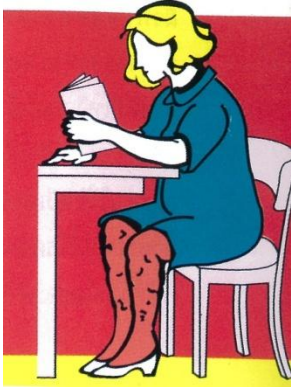
เล็บยาวเร็ว

ในหญิงมีครรภ์พบว่าเล็บจะยาวเร็วกว่าปกติ (ปกติเล็บมือจะงอกวันละ 0.1 มม. และเล็บเท้าจะงอกช้ากว่าเล็บมือ 2-3 เท่า ดังนั้น เล็บมือต้องใช้เวลา 6 เดือนจึงจะงอกเต็มแต่เล็บเท้าใช้เวลา 1 ปีครึ่งจึงงอกทั้งหมด) แต่เล็บจะเปราะและหักง่าย นอกจากนี้ยังอาจพบความผิดปกติต่างๆ เช่น พบรอยแนวขวางบนเล็บ ซึ่งเชื่อว่าทั้งหมดเป็นการเปลี่ยนแปลงตามธรรมชาติในหญิงมีครรภ์