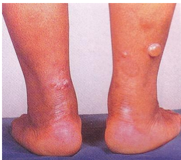
ภาพที่ แสดงตุ่มน้ำใส ผื่นผิวหนังจากการอักเสบติดเชื้อ และสะเก็ดแห้งกรังเนื่องจากหมัด

เมื่อหายแล้วตุ่มเหล่านี้มักเปลี่ยนเป็นสีน้ำตาลภายใน 2-3 สัปดาห์ และอาจจะหายไปภายใน 3-6 เดือน ดังนั้นวิธีการป้องกันก็ต้องรักษาความสะอาดของตัวเราและสัตว์เลี้ยงรอบๆ ตัว ไม่ว่าจะเป็นสัตว์เลี้ยงที่พำนักอาศัย โรงแรมตามต่างจังหวัดที่ไปพัก ผู้เขียนเคยเห็นตัวหมัดและไรวิ่งอยู่บนเตียงของโรงแรมเต็มไปหมด ซึ่งต้องระวังนะครับ ถ้าเป็นที่บ้านเราก็ควรจะพ่นยาฆ่าแมลงเพื่อฆ่ามันเสีย และเมื่อถูกกัดแล้วก็ต้องทายาพวกสเตียรอยด์ ถ้าคันมากอาจต้องรับประทานยาแก้คัน ยาแก้แพ้ หรือยาฆ่าแบคทีเรียร่วม ถ้ายังไม่ดีขึ้นให้รีบไปพบแพทย์ผิวหนังนะครับ