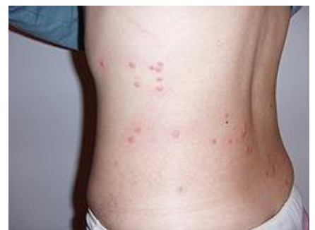
ภาพที่ แสดงตุ่มแดงที่หลังจากการเกา เนื่องจากหมัด