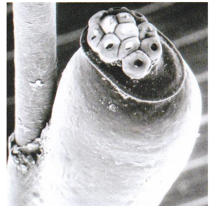
ภาพที่ ภาพจุลทรรศน์อิเล็กตรอนแสดง ไข่เหาซึ่งเกาะติดอยู่บริเวณเส้นผม