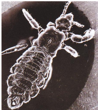
ภาพที่ ภาพจากจุลทรรศน์ อิเล็กทรอนิกส์แสดงเหาเพศผู้